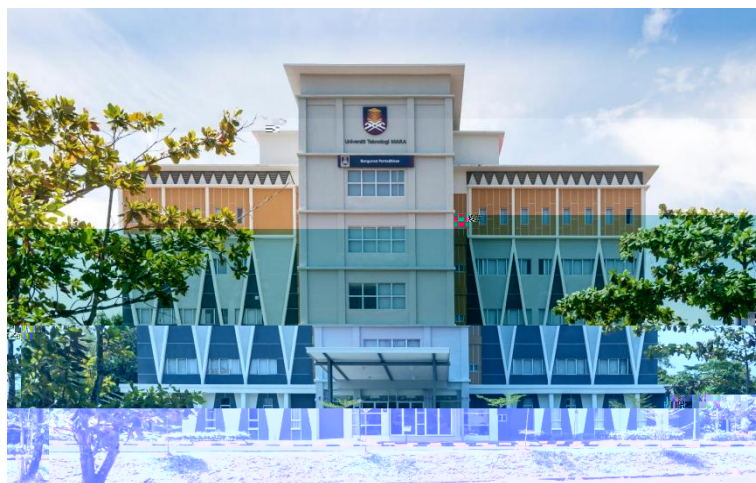
Administration Building / Rectorate