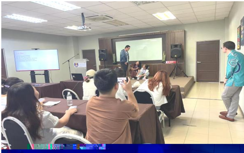
English Enrichment Course Class