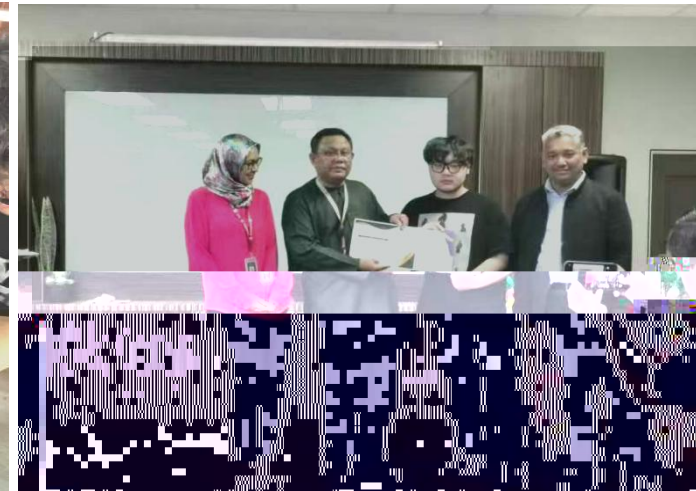
Certificate of Completion Grant