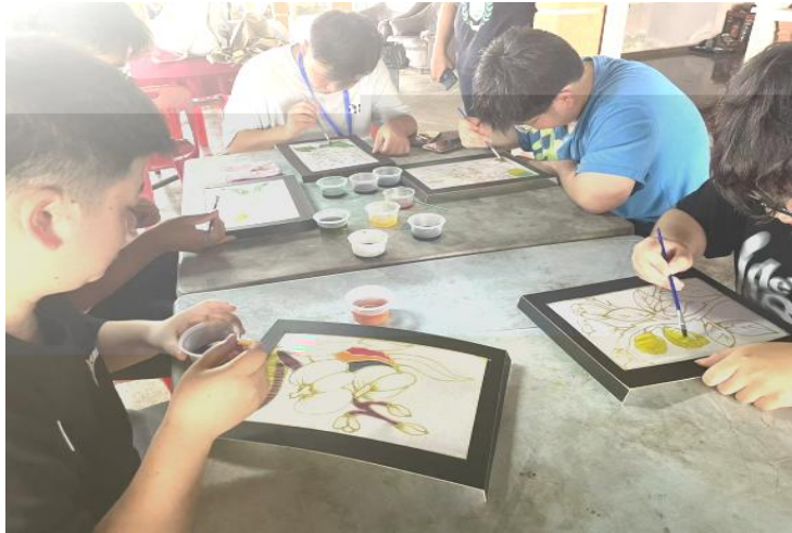
Experience Wax Painting&Drawing